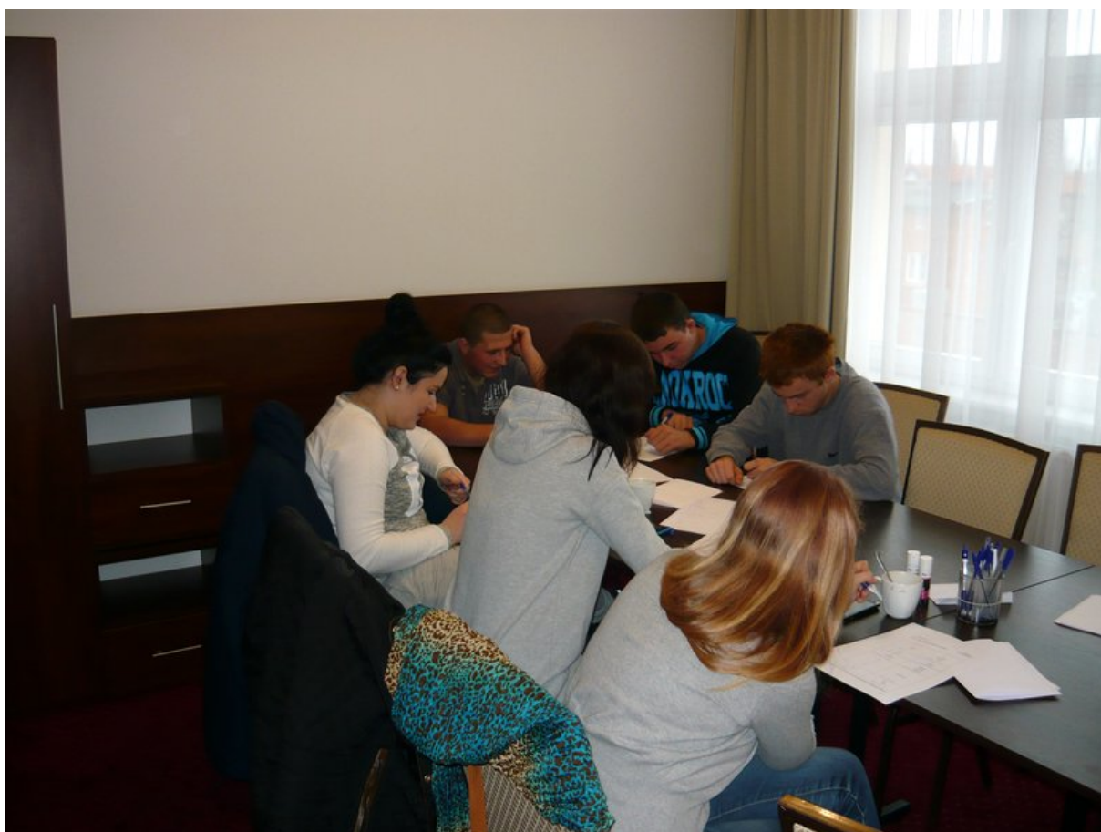
Na warsztatach z doradztwa zawodowego uczestnicy poznali m.in. swoje predyspozycje zawodowe.